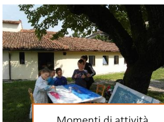
Momenti di attività

La nostra scuola è composta da 7 classi di scuola primaria per un totale di 132 alunni. Gli insegnanti sono 10 e il personale ausiliario è composto da: 1 segretaria, 6 addette doposcuola, 6 operatori ausiliari (quasi tutte con contratto part-time). La nostra scuola offre un servizio di tempo pieno (accoglienza dalle 7.15 e posticipo fino alle 18.00) con mensa interna. Come da PTOF esiste la possibilità di accogliere alunni certificati con disabilità e con bisogni educativi speciali, per i quali vengono predisposti i relativi PEI e PDP.