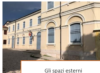
Gli spazi esterni

L'Istituto Canossiano prende il nome da Santa Maddalena di Canossa (Verona, 1774-1835) Fondatrice della Congregazione religiosa "Figlie della Carità", chiamate in seguito Canossiane. Le Madri Canossiane giunsero ad Arzignano il 19 dicembre del 1892 e si dedicarono alla formazione della gioventù femminile del territorio nelle modalità del tempo. Successivamente aprirono le scuole elementari e quelle medie e dal 1930 iniziarono le pratiche per avere il riconoscimento di entrambe da parte dello Stato. Ne ottennero la Parifica nel 1960. Ora non resta che la Scuola Primaria, divenuta Paritaria nel febbraio 2001. Da settembre 2019 la Cooperativa Sociale "Cultura e Valori" di Verona subentra come gestore della Scuola Primaria condividendo l'attuale impostazione della scuola sia dal punto di vista didattico che formativo. Con tale modalità di collaborazione lo stile e il carisma canossiano si collegano e valorizzano l'ampia rete di proposte formative proposte dalla cooperativa.