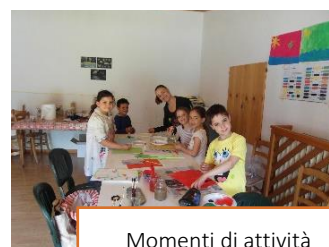
Momenti di attività