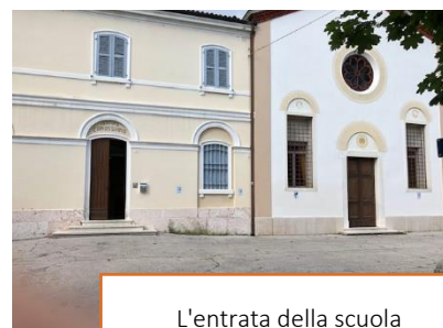
L'entrata della scuola