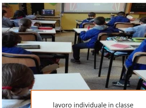
lavoro individuale in classe

sono stati presentati nel capitolo dedicato alla scuola materna e nido. Anche questa attività è passata sotto la gestione della Cooperativa Cultura e Valori dal 2014. In sintonia con gli altri percorsi scolastici la scuola mantiene l'impegno primario condividere con docenti, educatori e genitori un progetto educativo che vede al centro del proprio operare la figura di Gesù Cristo, Vero Maestro e punto di riferimento.