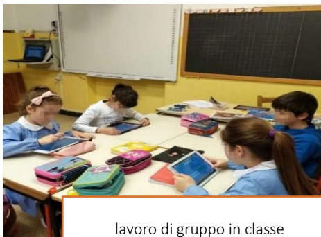
lavoro di gruppo in classe

La scuola primaria rappresenta la dimensione scolastica dell'Istituto "Virgo Carmeli" i cui tratti storici essenziali