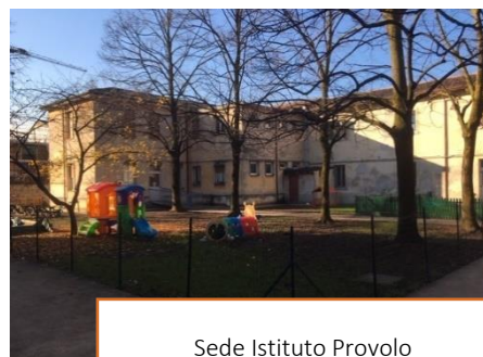
Sede Istituto Provolo

La struttura scolastica attuale si inserisce all'interno della struttura in cui era nata nella prima metà dell'Ottocento l'opera di Don Antonio Provolo. Nato nel 1801 D. Provolo si colloca nel solco della tradizione dei santi sociali della città di Verona. L'impegno educativo prescelto dal fondatore era quello dei ragazzi sordomuti. Nella storia più recente la struttura del Provolo nel quartiere del Chievo ha visto gradualmente aprirsi una esperienza scolastica strutturata con un nido, la scuola materna, la scuola primaria. Ultimo servizio aggiunto la scuola secondaria di primo grado nel 2011: la Scuola paritaria Provolo Dal 2015. Tutte le attività scolastiche sono passate sotto la gestione della Cultura e Valori.